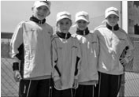
»Kleider machen Leute«, oder wie der Trainer sagt: »Gewinner!«