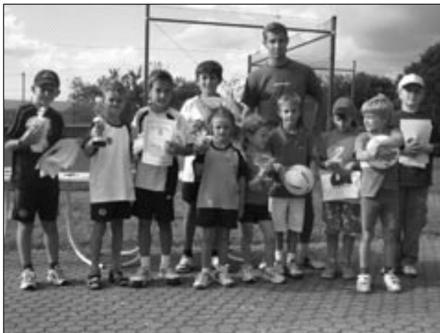
Thommy und die sieben Zwerge? Nein, zehn Knaben des TCK mit einem Trainer... Bild aus der Saison 2005

Unsere Knaben haben eine tolle Runde hingelegt. Mit nur einer Niederlage aus fünf Begegnungen wurde der Aufstieg geschafft. Dabei wurden in den vier gewonnenen Spielen gerade mal drei Einzelpunkte abgegeben. Schon vor der Saison war klar, dass nur der Aufstieg das Ziel unserer Jungs sein kann.