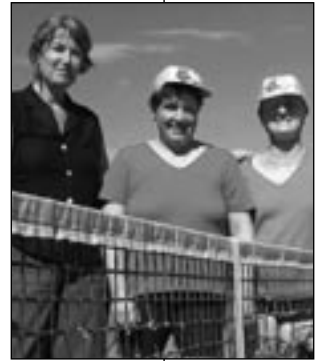
Die Mannschaft des Ortschaftsrats wurde diesmal nur Achter, hatte aber ihren größten Fan gleich selbst mitgebracht

So viele Attraktionen hatte das Sommerfest mit dem Turnier der örtlichen Vereine des TCK noch selten: Sommer pur bei bestem Tenniswetter, Geschicklichkeitsspiele für die Teilnehmer und die Zuschauer, Live-Übertragung des WM-Finales, Bewirtung für jeden Geschmack, zum ersten Mal eine reine Damenmannschaft des Ortschaftsrates und die AH (Attraktive Herren!) des TSV. Acht