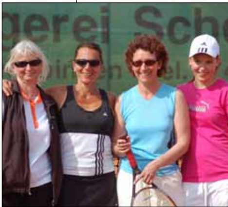
Gruppenbild mit vier jungen Damen