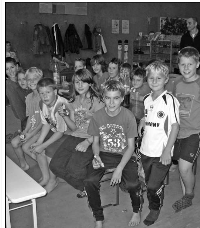
Zufriedene Gesichter, auch wenn die Socken schon mal weg waren

Auch in diesem Jahr fand der Abschluss der Jugend wieder im EmKa in Hirschau statt. Am 18. Oktober trafen sich 15 Kinder mit Betreuern und Fahrern auf den Kiebingener Tennisplätzen, um nach Hirschau zu fahren. Im EmKa selbst gingen die drei Stunden wie im Fluge rum. Die Kids, wie auch die Betreuer, hatten einen Riesenspaß an den