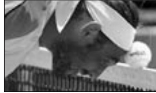
Links: Marcos Baghdatis spielt mit allem was ihm zur Verfügung steht. Wenn es sein muss, mit dem Kopf.

»...Er ist zwar nicht gut für die Füße und Knie, eigentlich für den ganzen Körper eher ungesund. Aber der Aufprall und der Drall, den der Ball entwickelt, ergibt das höchstklassigste Tennis des ganzen Jahres.«