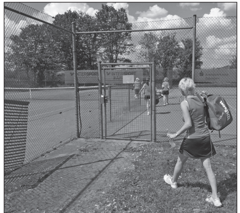
Saisoneröffnung und Gastspiel in der Tennishalle in Gomaringen: beide Events waren gut besucht und echte Highlights im Tennisjahr 2016.