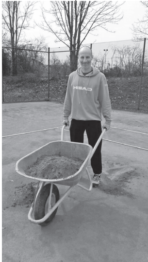
Nicht nur mit der Schubkarre seit Jahrzehnten für den TCK aktiv

Loslassen... Wenn ich genau überlege, war die Zeit als Jugendwart auch irgendwie die schönste Zeit. Auch deshalb wünsche ich mir, dass wir wieder mehr Kinder und Jugendliche in Kiebingen für diesen tollen Sport finden und der Verein noch